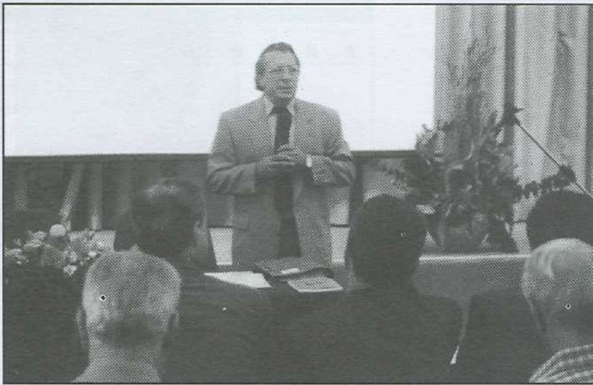
Πανελλήνιο Πανομογενειακό Συνέδριο: «Ελληνόγλωσση εκπαίδευση στο εξωτερικό», Ρέθυμνο 26-28 Ιουνίου 1998

την ίδρυση του μέχρι σήμερα μια σειρά από εκπαιδευτικά ευρωπαϊκά προγράμματα (π.χ. Comenius), καθώς και δύο μεγάλα ερευνητικά και συγχρόνως επιμορφωτικά προγράμματα, από τα οποία το ένα αναφερόταν στην ελληνόγλωσση εκπαίδευση και στην επιμόρφωση των Ελλήνων εκπαιδευτικών στο Βέλγιο και στη Γαλλία. Το δεύτερο ήταν πανελλαδικό και απευθυνόταν κυρίως στους εκπαιδευτικούς της πρωτοβάθμιας εκπαίδευσης που δίδασκαν παλιννοστούντες και αλλοδαπούς μαθητές.