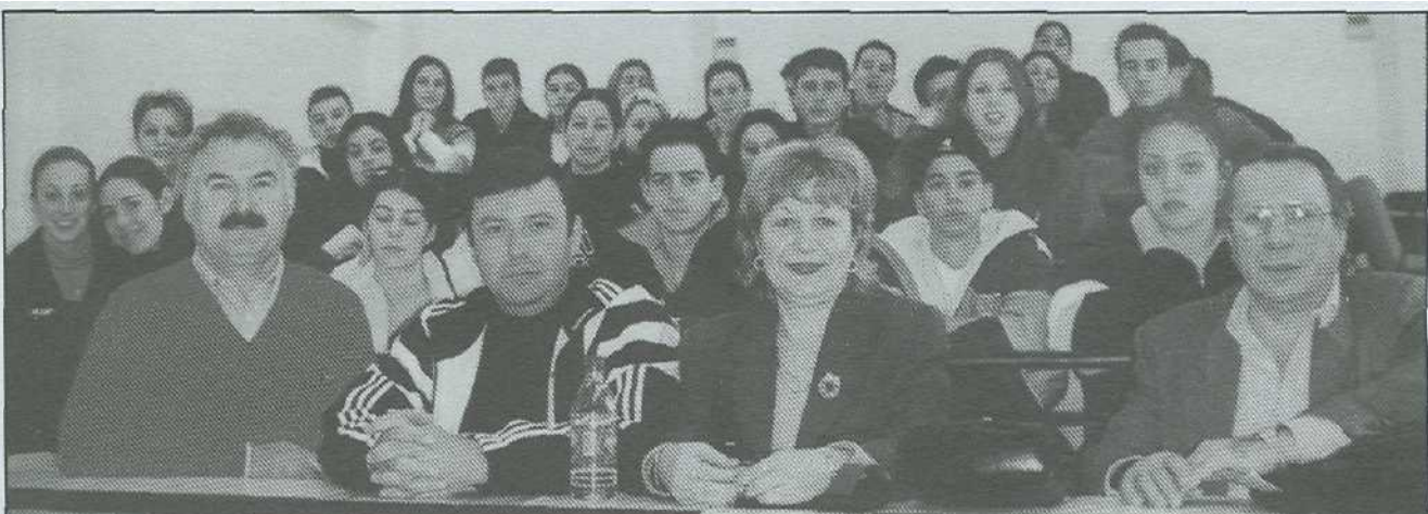
Επιμορφωτικό σεμινάριο για ομογενείς εκπαιδευτικούς από Αυστραλία και Ν. Αφρική, Ιανουάριος 1999

Σκοπός του προγράμματος «Παιδεία Ομογενών» είναι η καλλιέργεια και η προώθηση της ελληνικής γλώσσας και του πολιτισμού σε μαθητές ελληνικής και μη καταγωγής που ζουν στο εξωτερικό και φοιτούν σε σχολεία της πρωτοβάθμιας και δευτεροβάθμιας εκπαίδευσης. Στοχεύει επίσης στην επιμόρφωση των εκπαιδευτικών, στην υλοποίηση εκπαιδευτικών προγραμμάτων για μαθητές, καθώς και στη δημιουργία βάσεων δεδομένων και δικτύων επικοινωνίας.